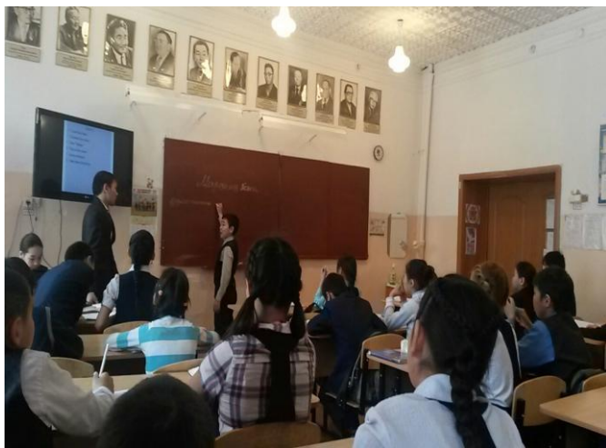
Во время педагогической практики