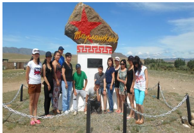
Фольклорная практика (Тес-Хемский кожуун)